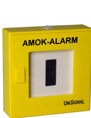
Funk-Druckknopfmelder Amokalarm UniSignal EA

Kein Draht, keine Batterie, keine Sorgen