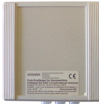
Funk-Empfänger UniSignal EG