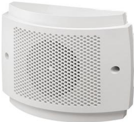
Ethernet Pausen-Signalisierung UniSignal CN