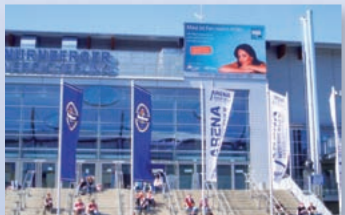
Nürnberger Versicherung Arena (LED-Werbepanels)