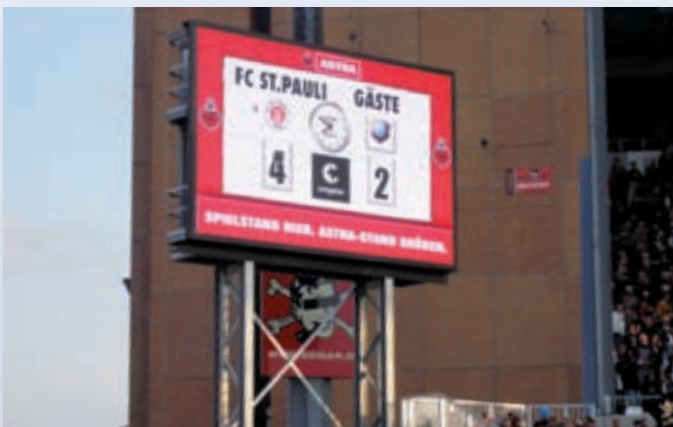
Millerntor Stadion, Hamburg (LED-Videodisplay)