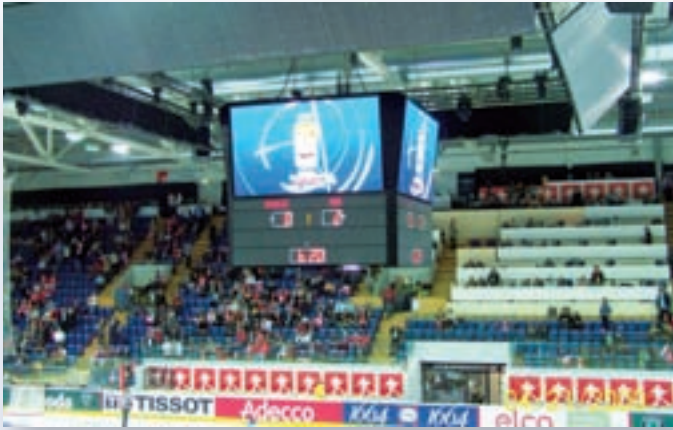
Arena Kloten (LED-Videocube mit Scoreboards)