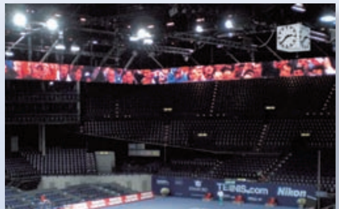
Hallenstadion Zürich (LED-Werbepanels mit Hallen-Uhrenwürfel)