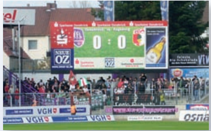
Osnatel Arena, Osnabrück (Kombination LED-Videodisplay, Analoguhr und Prismenwender)