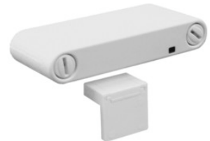
Funkkontakt zur Türüberwachung