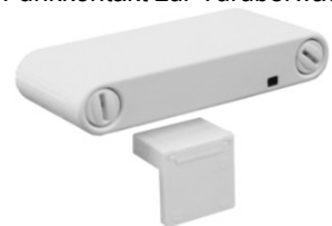
Funkkontakt zur Türüberwachung