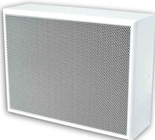
Kombi-Signalgeber UniSignal KD

Der Alleskönner für den Einsatz in Schulen